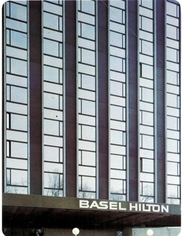
Hotel Basel Hilton, Basel, Schweiz, 1975 INFRASTOP-Silber 36/33 T – Arch. Rickenbacher+Wegmann, Basel

FLACHGLAS AG ...ein guter Name für gutes Glas