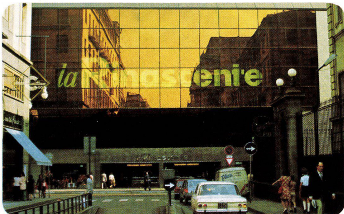
La Rinascente Torino, Italien, 1973 SIGLA-INFRASTOP-Gold 50/33 – Arch. Bordogna, Torino