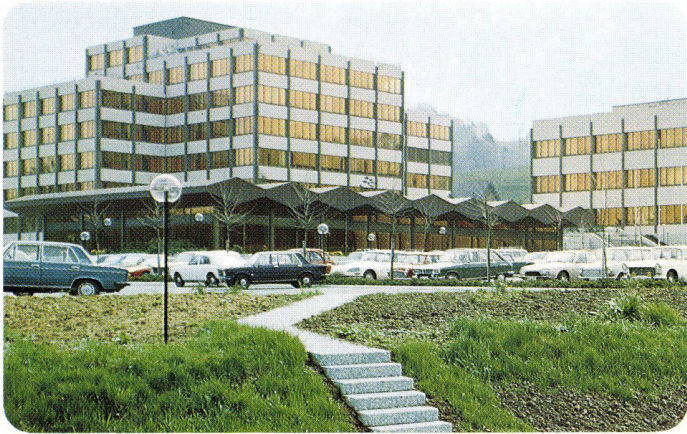
Dow-Center Horgen, Schweiz, 1973 INFRASTOP-Gold 40/26 T – Arch. R. Leuzinger, Pfäffikon SZ

Bedingungen. Mit INFRASTOP-Sonnenschutzgläsern gestaltet der Architekt raffinierte Fassadenästhetik und individuelles Raumklima.