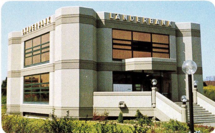
Länderbank Linz, Österreich, 1973 INFRASTOP-Gold 40/26 – Arch. Prof. A. Perotti