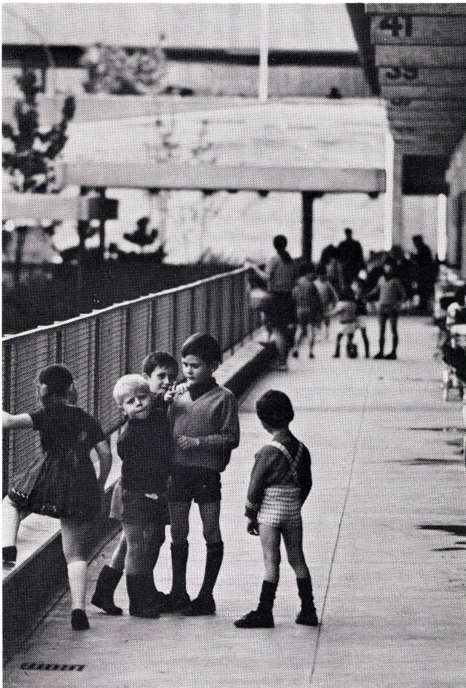
7 Photoausstellung «Der wunde Punkt» im Ladenzentrum der Gäbelbachsiedlung.