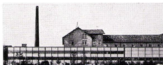
Jörg Affolter, dipl. Architekt ETH

U. Schärer Söhne AG-USM Stahlbau-System «Haller» 3110 Münsingen 031 92 14 37