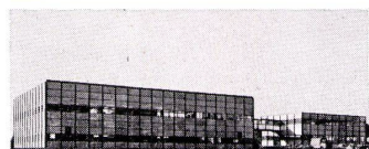
B. + F. Haller, Architekten BSA

U. Schärer Söhne AG-USM Stahlbau-System «Haller» 3110 Münsingen 031 92 14 37