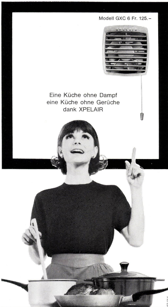
Modell GXC 6 Fr. 125.-

Eine Küche ohne Dampf eine Küche ohne Gerüche dank XPELAIR