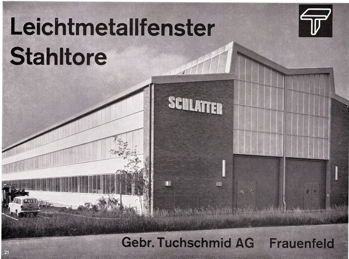
Gebr. Tuchs Schmid AG Frauenfeld