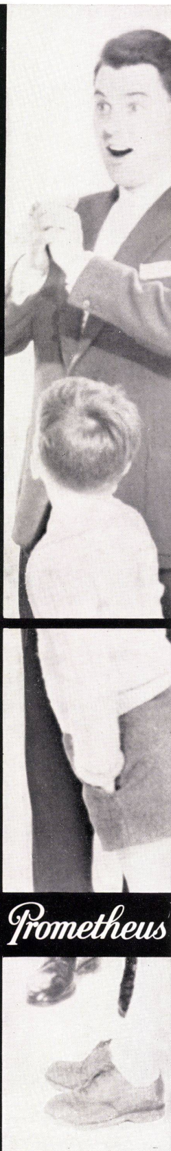
Dr. M. Heuberger / Gestaltung H. Buholzer

bereitet Ihnen das Kochen und Backen wenn PROMETHEUS-BEL-DOOR-Backofen und -Kochplattenteil getrennt je auf der richtigen Gebrauchshöhe eingebaut sind. BEL-DOOR, der schönste und modernste Elektroherd mit Leuchtschaltern, beheizbarer Geräteschublade, schrägem Schalterpult, grossem Backofen mit aushängbarer Türe und Schauglas, Innenbeleuchtung, Thermostat, Infrarotgrill sowie Grillspiess mit Motor.