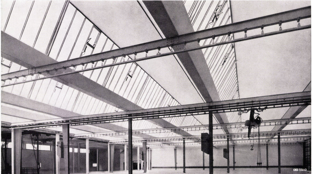
Geilinger & Co. Winterthur