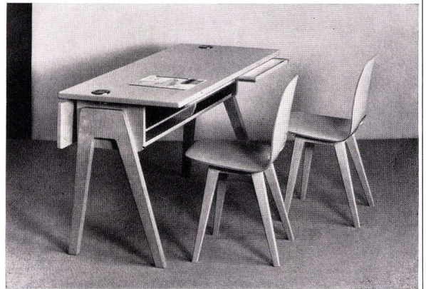
Pult Mod. 4152 T Stuhl Mod. 4083

AG Möbelfabrik Horgen-Glarus in Glarus Telefon 058/5 20 91