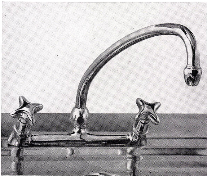
Nr. 1577 Einkörper-Mischbatterie für Chromstahl-Spültische