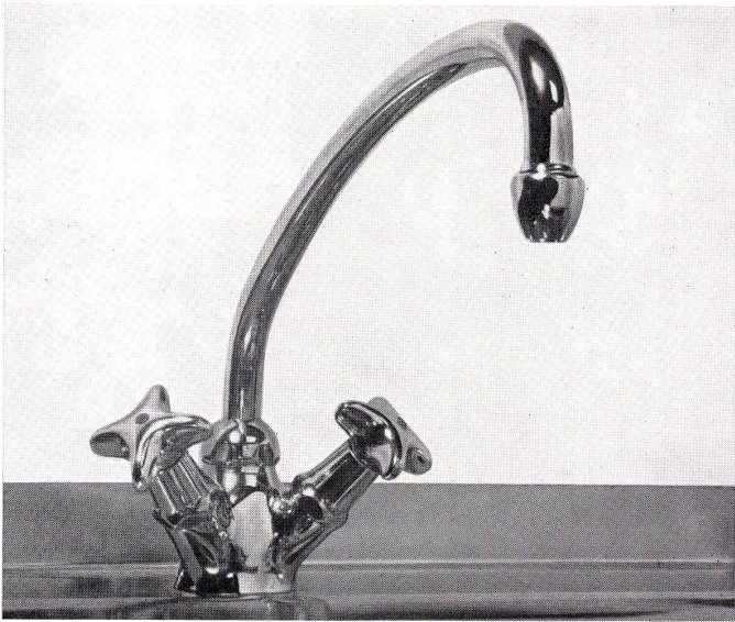
Nr. 1578 Einloch-Mischbatterie für Chromstahl-Spültische