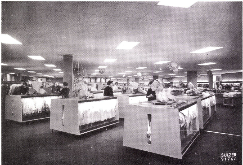
Verkaufsraum eines grossen Warenhauses mit Sulzer- Luftkonditionierungsanlage

Die Vielgestalt der heutigen Bauweise, die Differenzierung der Ansprüche an das Raumklima spiegeln sich in der erstaunlichen Auswahl von Systemen für Klimaanlage. Im Arbeitsprogramm von Gebrüder Sulzer finden Sie unter anderem: Sulzer-Klimaapparate für Einzelräume, Verkaufslokale, Laboratorien usw. Konventionelle Sulzer-Klimaanlagen mit Zonenregulierung