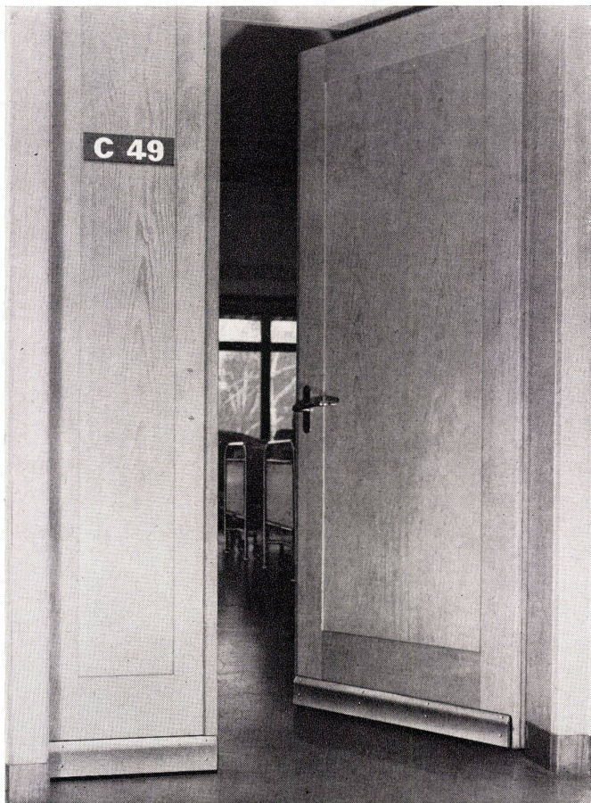
Automatischer Türabschluß für schwellenlose Türen

unsichtbar zum Einnutzen aufgesetzt mit elox. Aluminiumsockel