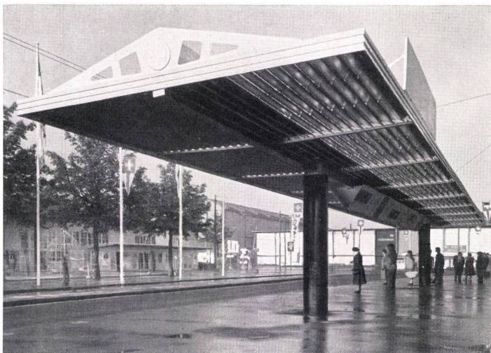
Perrondach vor dem Mustermessebau, Basel