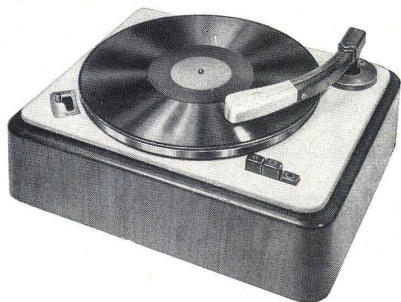
Audiomatic CBA 83 GE Pr mit eingebautem Vorverstärker und regulierbarem Pick-up

The loads of the three supporting walls of the transverse wall construction which has been employed rest on the strongly built original foundations.