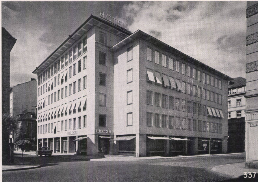
Glärnischhof Zürich, 1951 Fassadenverkleidung in künstlichem Muschelkalk