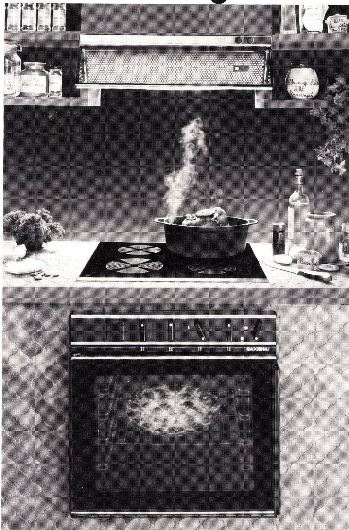
Zum Beispiel: die Glaskeramik-Kochfläche mit Einbauherd und Dampfzug