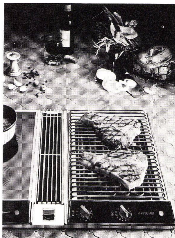
Zum Beispiel: die Glaskeramik-Kochfläche mit Einbauherd und Dampfabzug