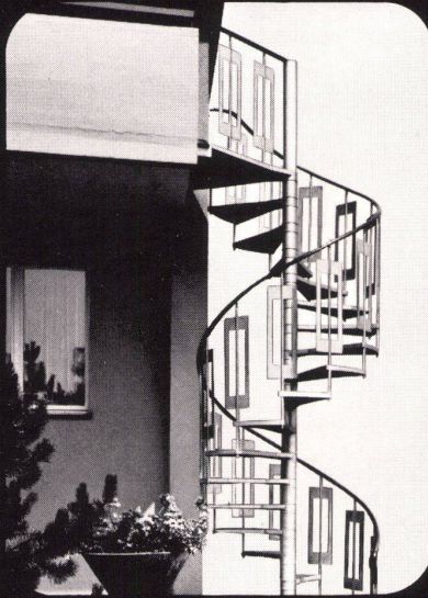
Verbindung Garten zum 1. Stock