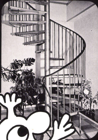
Aufgang in den 1. Stock