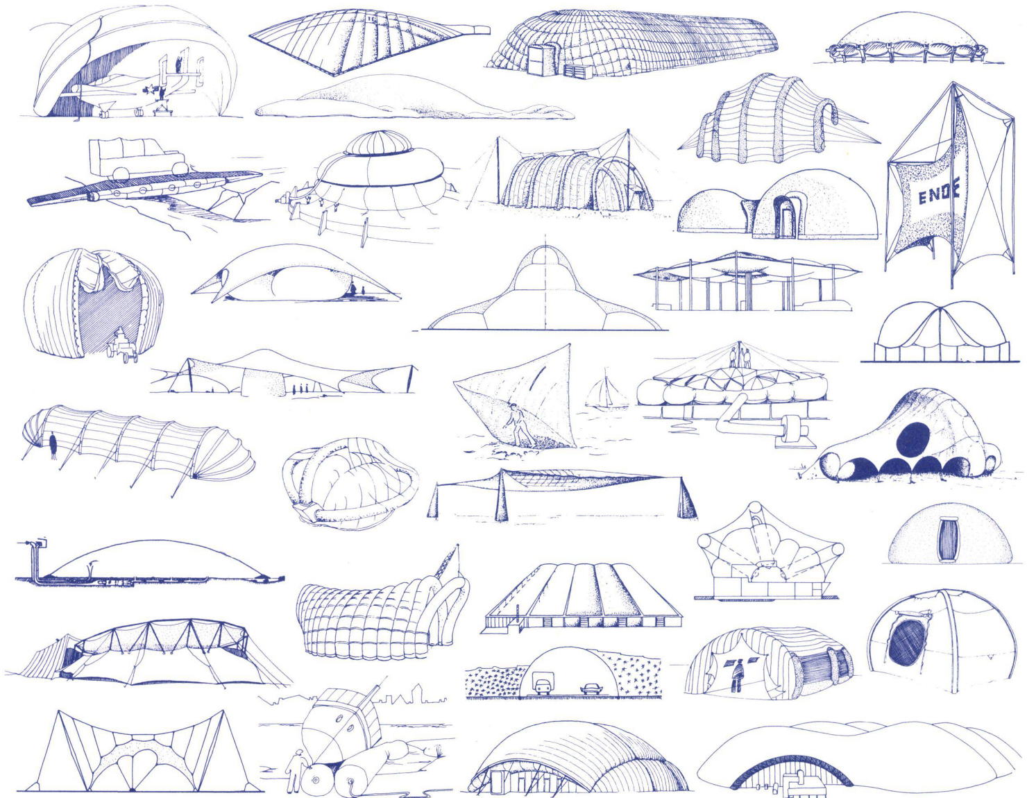
Lufthallen und andere Pneus

Eine der zur Zeit anstehenden Aufgaben für die Forschung ist für die Praxis das Grundrepertoire leichter Flächentragwerke anwendbar zu machen, um bauwirtschaftlich, konstruktiv wie auch ästhetisch ansprechende Lösungen für Bauten unserer Zeit zu finden. Die nachfolgenden Skizzen sollen aus dieser Vielfalt im Hoch- wie auch im Ingenieurbau einige Beispiele und Anregungen zeigen.