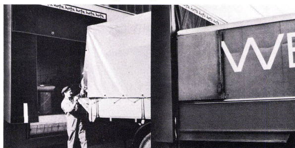
RENE EGGER U.S.M.

Probleme sind da, um von Geilinger gelöst zu werden.