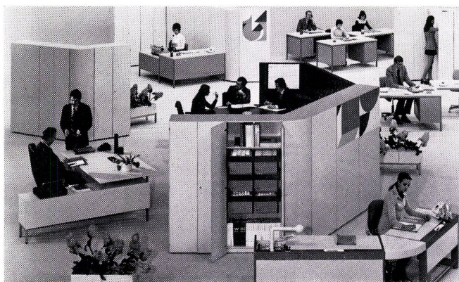
Großraumbüro, Programm Section