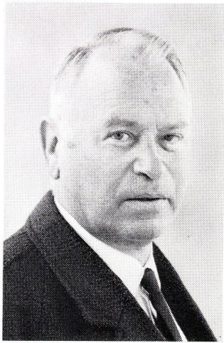
Alfred Altherr (1911–1972).