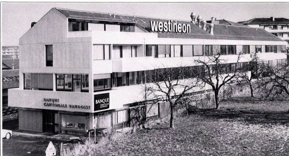
Nouvelle usine Westineon à Cheseaux-sur-Lausanne. Architectes: MM. Suter & Suter, avenue V.-Ruffy 4, Lausanne 98 stores Tous-Temps à lames bordées 80 mm 9 stores vénitiens Lamelcolor à lames flexibles 50 mm.