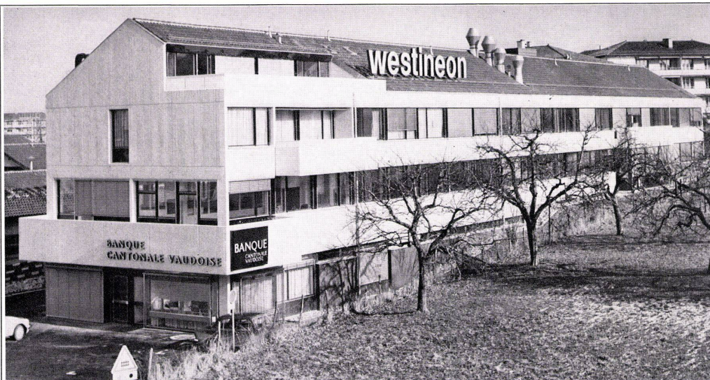
Nouvelle usine Westineon à Cheseaux-sur-Lausanne. Architectes: MM. Suter & Suter, avenue V.-Ruffy 4, Lausanne 98 stores Tous-Temps à lames bordées 80 mm 9 stores vénitiens Lamelcolor à lames flexibles 50 mm.