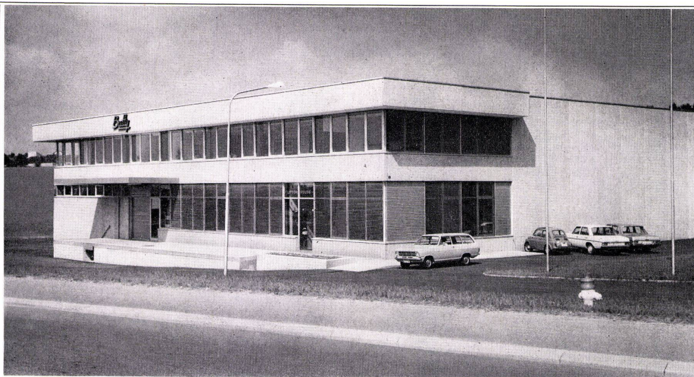
Usine Butty SA Crissier/Lausanne Architectes MM. de Freudenreich & Strobino Avenue de Rumine 22 Lausanne Stores vénitiens Tous-temps à lames bordées 80 mm.