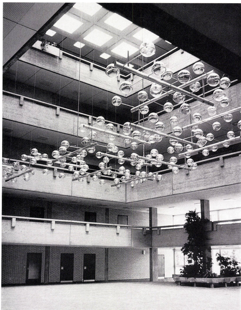
5 Innenraum des Pädagogischen Zentrums. L'intérieur du centre pédagogique. Interior of the Education Centre.