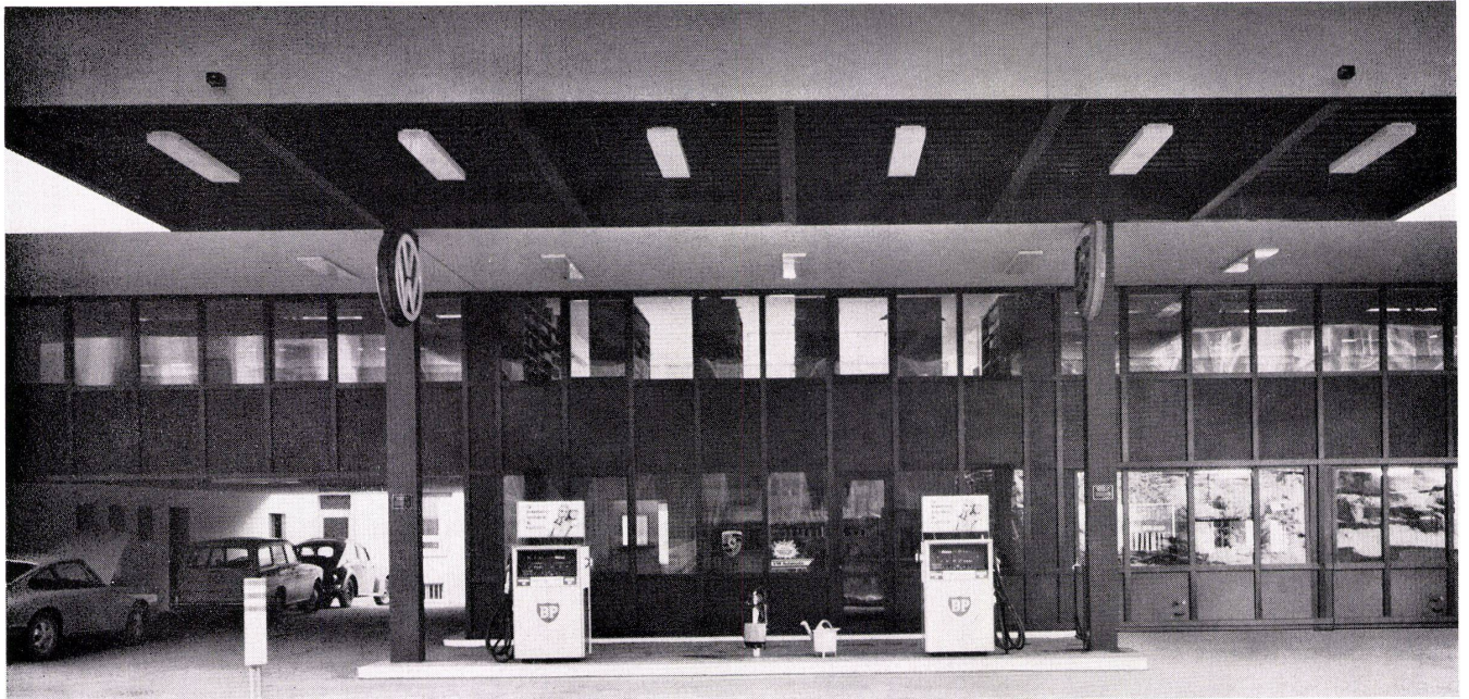
Vordachkonstruktionen und Metallfassaden

Metallbauarbeiten an einer Tankstelle. Projektierung und Ausführung der selbsttragenden Vordachkonstruktion, der Metallfassade und der Eingangspartien in broncefarbenem Leichtmetall.