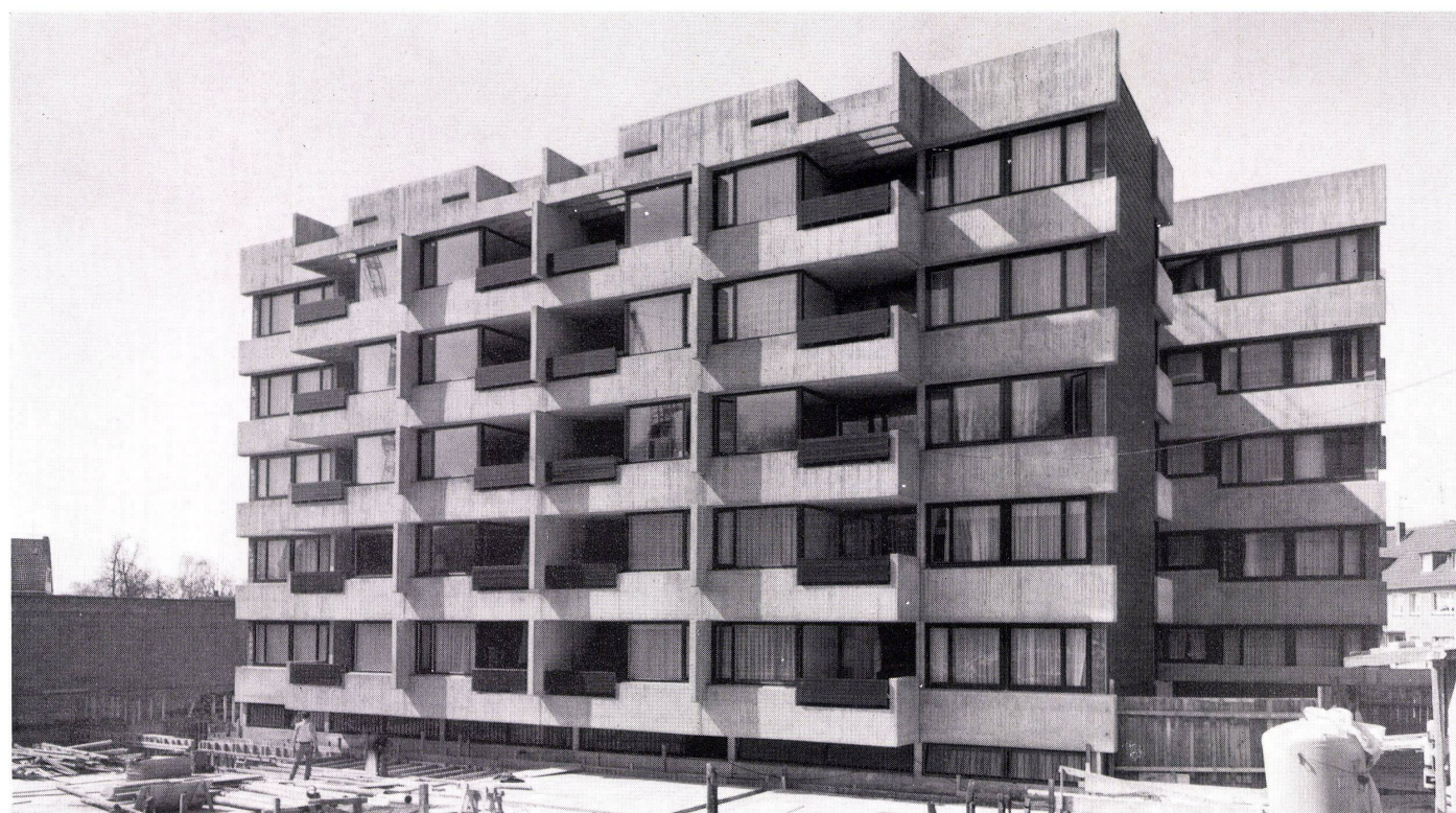
4 Ansicht eines Wohnblocks. Vue sur un bloc d'habitation. View of a residential block.