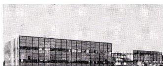
B. + F. Haller, Architekten BSA

U. Schärer Söhne AG-USM Stahlbau-System «Haller» 3110 Münsingen 031 92 14 37