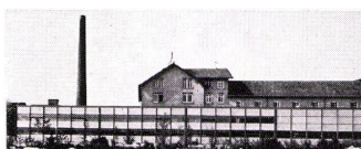
Jörg Affolter, dipl. Architekt ETH

U. Schärer Söhne AG-USM Stahlbau-System «Haller» 3110 Münsingen 031 92 14 37