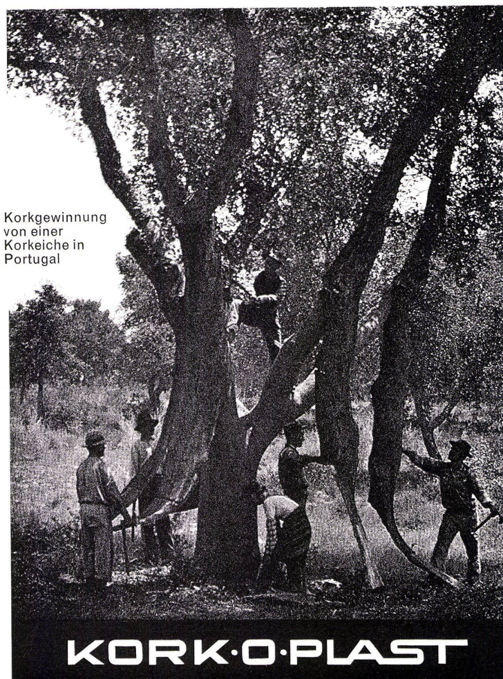
Korkgewinnung von einer Korkeiche in Portugal

9009 ST. GALLEN Lukasstrasse 30 071 / 24 68 65 8040 ZÜRICH Badenerstrasse 329 051 / 54 86 86 1700 FRIBOURG 3, avenue Beauregard 037 / 2 48 06 7002 CHUR Gäuggelistrasse 4 081 / 22 06 45 6000 LUZERN Unt. Dattenbergstr. 8 041 / 41 10 86