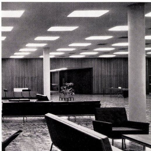
Siemens-Innenleuchten in einem Geschäftshaus

Siemens Innenleuchten für Büros, Wohnungen, Lagerhallen, Fabrikräume, Garagen usw. werden genau auf die geforderten Lichtverhältnisse abgestimmt. Unsere grosse Erfahrung garantiert Ihnen die beste Lösung aller Beleuchtungsprobleme.