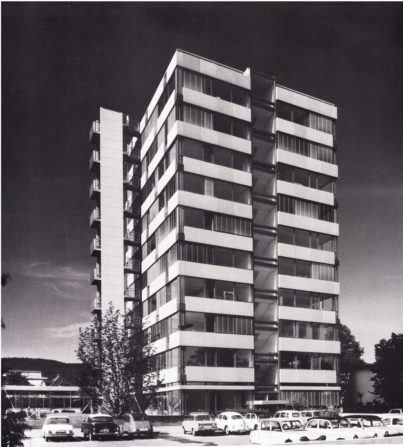
Bürohaus Alusuisse in Zürich-Altstetten

HZ- Aluminiumfenster und -Fassaden für alle Bauten