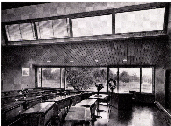
Schulhaus Obfelden ZH