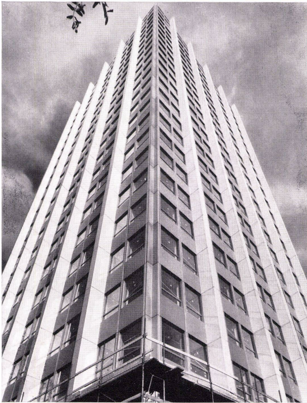
Gebrüder Sulzer, Aktiengesellschaft