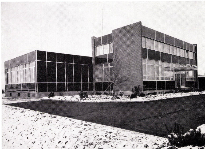
Distillerie König, Steinhausen ZG