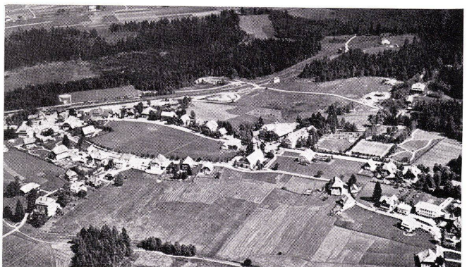
2 Hinterzarten im Schwarzwald. Beispiel einer Gemeinde mit rückläufiger landwirtschaftlicher Struktur im Übergang zum aufstrebenden Fremdenverkehrsort.