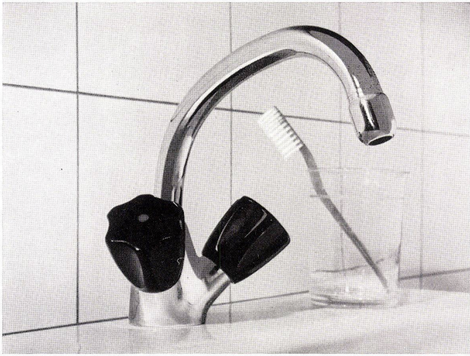
Einloch-Waschtischbatterie Nr. 3073