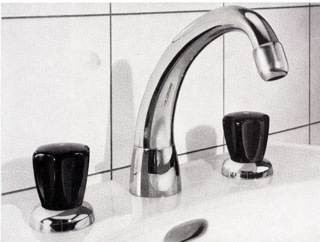
Waschtischbatterie Nr. 3076

Eingedenk der Tatsache, daß die formschöne Armatur ein wesentliches Element moderner Wohnkultur darstellt, hat KWC eine Reihe neuer Waschtischarmaturen entwickelt, die dank ihrer zeitlosen Eleganz und ihrem qualitativen Niveau Spitzenprodukte repräsentieren. Modernes Formempfinden und traditionelles Streben nach überragender Qualität waren die Leitmotive bei der Entwicklung dieser neuen Armaturentypen.