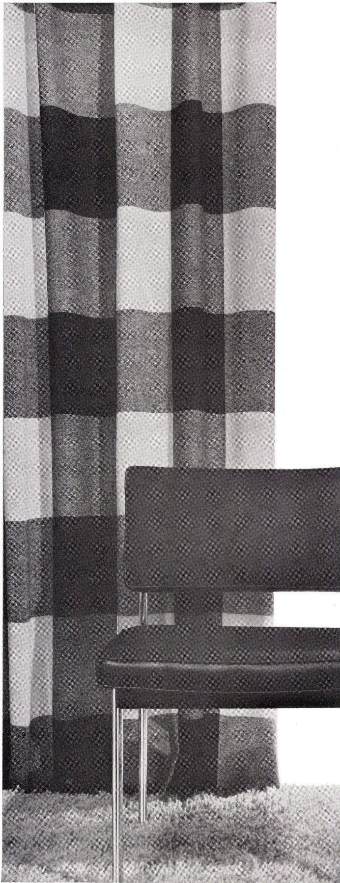
der neue Vorhang aus der internationalen Auswahl exklusiver Stoffe