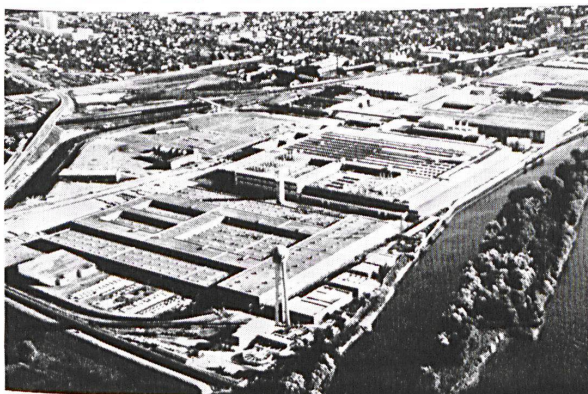
SIMCA fabrik - Poissy - 25.000 m 2 FILTRASOL

Die wärmeabsorbierenden FILTRASOL Draht- und Gussgläser von blaugrünem Farbton