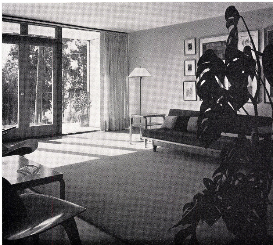
Wohnzimmer. Salle de séjour. Living room.