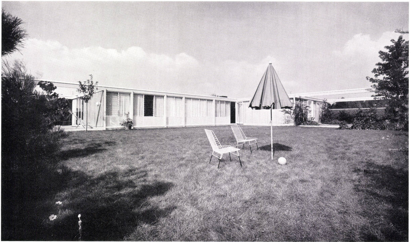
Der Wohngarten. Le jardin-séjour. Garden seating area.