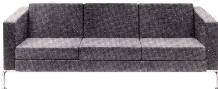
Sofa Mod. wh 200 206 cm lang ab Fr. 1220.- 266 cm lang ab Fr. 1500.-

Die sogenannte Kunststoffplatte hat sich in der Praxis seit Jahren bewährt. Ihre spiegelglatte, stoß- und