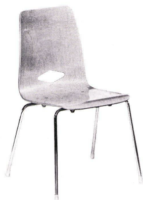
Modell 6006 S

Satz und Druck Huber & Co. AG, Frauenfeld