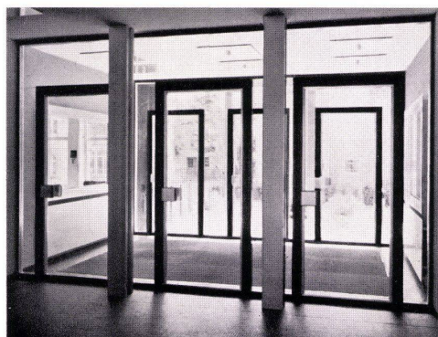
Schaufenster-Anlagen Türen — Portale

Bürogebäude der Radiatorenfabrik Gebr. Zehnder AG, Gränichen H. Hauri, dipl. Arch. ETH, Reinach AG