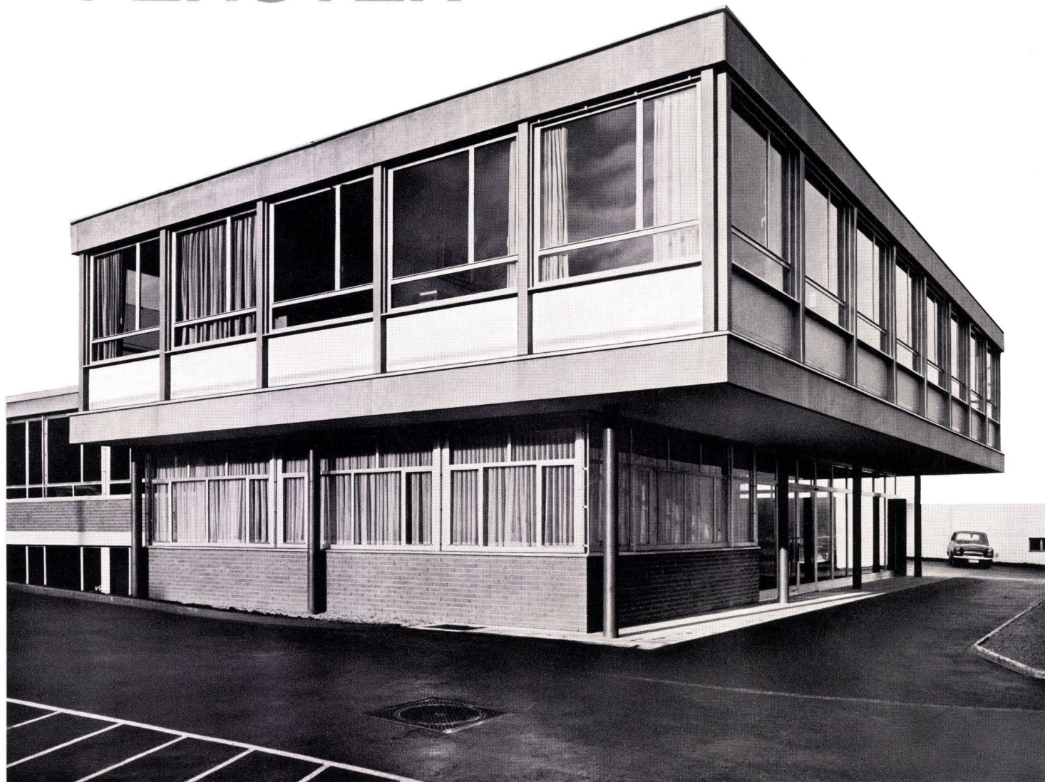
Modernes GLISSA-Bauprofil-Programm Konstruktionen für höchste Ansprüche

Bürogebäude der Radiatorenfabrik Gebr. Zehnder AG, Gränichen H. Hauri, dipl. Arch. ETH, Reinach AG