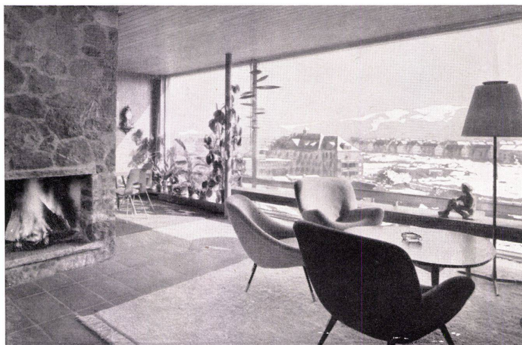
Wohnhaus von Architekt A. Leimbacher, Baden