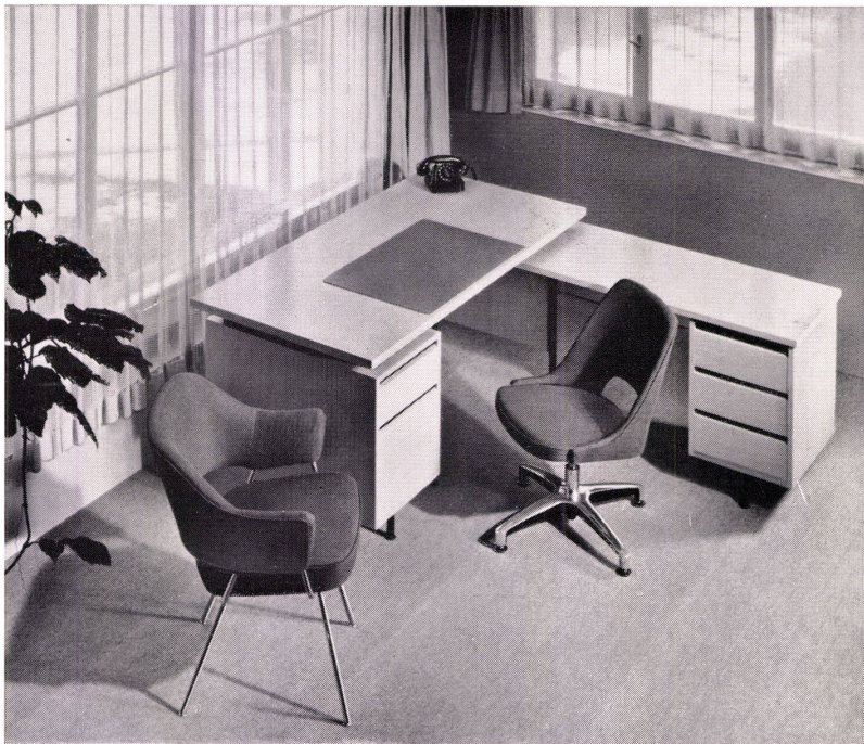
futura Büromöbel - für neuzeitliche Direktionsbüros und Konferenzräume

Ausstellung und Verkauf bei 30 offiziellen Vertretungen. Bezugsquellennachweis durch die Fabrikanten: Girsberger Co Stuhl- und Tischfabrik Bützberg/BE Aebi & Cie Möbelfabrik Huttwil/BE