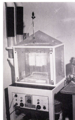
3 Korrosionsschutz-Prüfgerät mit automatischer Programmsteuerung (Tropenklima, Hochseetransport).