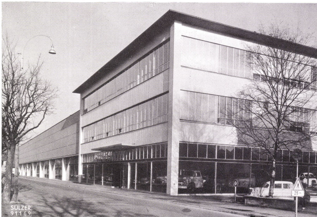
Montagewerk. Wärme- und lufttechnische Einrichtungen

Die Wärmewirtschaft stellt vielfältige Aufgaben. Am anspruchsvollsten zeigt sie sich dort, wo Probleme der Wärmeerzeugung, Wärmeverteilung, Beheizung, Lüftung und Luftkonditionierung gemeinsam zu lösen sind. Die Zusammenarbeit mit einer einzigen Firma bringt dem Bauherrn und Architekten ganz bedeutende Entlastung. Die Qualität unseres Mitarbeiterstabes und die unvergleichliche