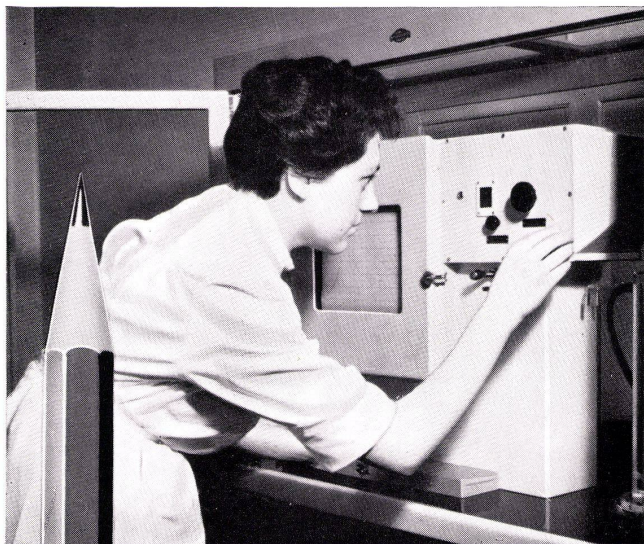
Sedimentationswaage für die Graphit-Korngrößen-Bestimmung

Als man im 16. Jahrhundert den Graphit als Schreibmaterial entdeckte, hielt man ihn für ein Bleimetall. Man ahnte damals nicht, wie intensiv sich noch vier Jahrhunderte später die Wissenschaftler in den Bleistiftfabriken damit beschäftigen würden.