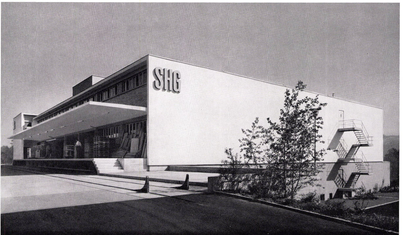
Ansicht von Nordwesten mit dem Lagerhaus